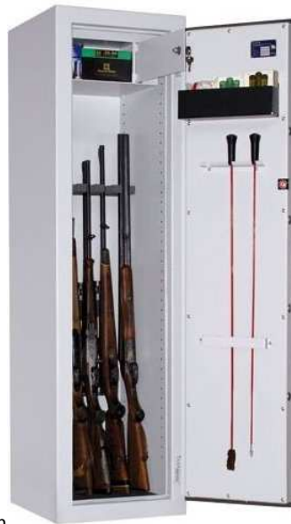
Abb. WSN 150/40