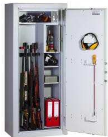
Abb. Modell WSB-4