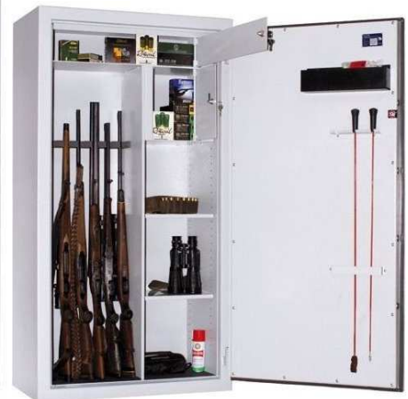
Abb. WSN 150/80