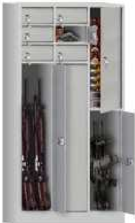
Abb.: Fachanlage für Waffen, z.B. Justiz, Polizei