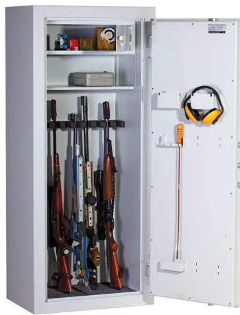
Abb. Modell WSB 3