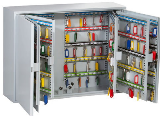
Abb. GSC 600