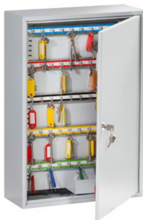
Abb. GSC 200

Sockel (Rohrgestell 500 mm hoch) gegen Aufpreis lieferbar