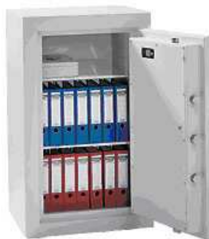
Abb. Modell 3