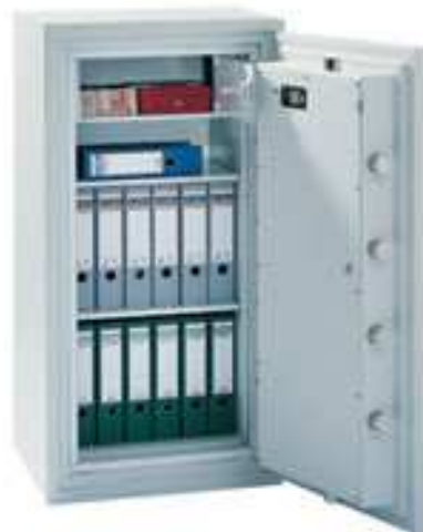
Abb. Modell 4