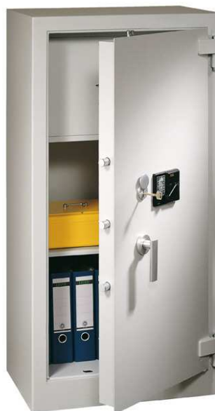
Abb. Modell SGIVS-1-D mit ELO