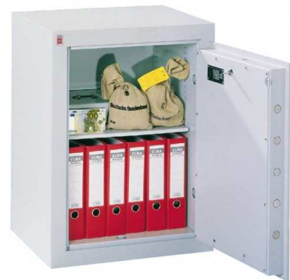
Abb. Modell 1