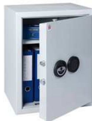
Abb. GMT 6/E