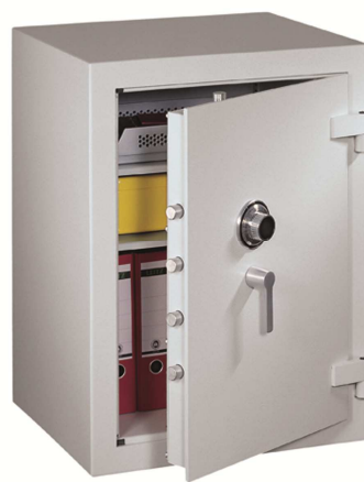
Abb. Modell 80 mit mechan. Codeschloss (Aufpreis)