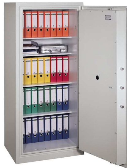
Abb. Modell SGIIVS-2-A