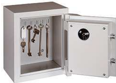
Abb. Modell SEB 1